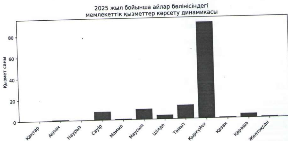
Сурет 1. 2025 жыл бойынша айлар бөлінісіндегі мемлекеттік қызметтер көрсету динамикасы.